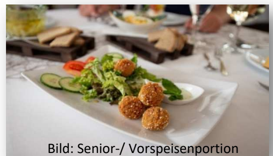
Bild: Senior-/ Vorspeisenportion

Kichererbsen-Bällchen mit Rote Bete und Ingwer in einer Veggie-Panade mit Karotte und Quinoa auf Salatbett mit hausgemachtem Balsamico Dressing 14,50