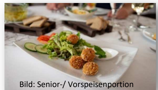
Bild: Senior-/ Vorspeisenportion

Kichererbsen-Bällchen mit Rote Bete und Ingwer in einer Veggie-Panade mit Karotte und Quinoa auf Salatbett mit hausgemachtem Balsamico Dressing 14,50